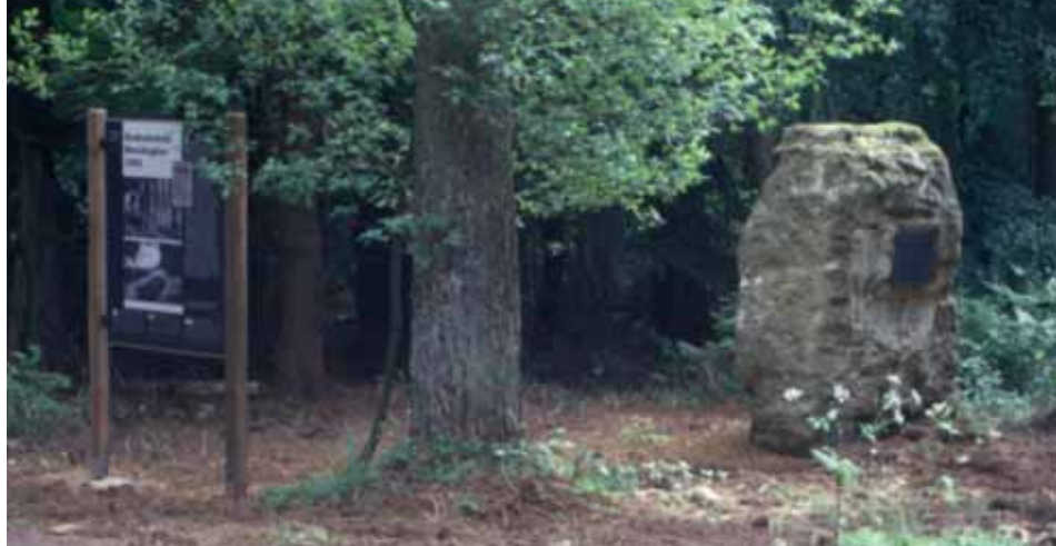
Gedenkstein für die 1942 ermordeten Teilnehmer des Luxemburger Generalstreiks

in Berlin vorgelegt, welches entschied, dass die 25 Luxemburger sofort zu erschießen seien.