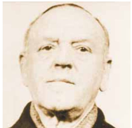
Lagerkommandant Hermann Pister nach seiner Verhaftung

als „Arbeitserziehungslager“ für am Westwall eingesetzte, im nationalsozialistischen Sinne straffällig gewordene, Arbeiter der Organisation Todt (OT) errichtet. Während des Zweiten Weltkrieges entwickelte es sich zu einem Konzentrationslager für Deportierte aus zahlreichen von der Wehrmacht besetzten Ländern. Aufgrund der verschiedenen Sonderfunktionen, die dem Lager im Laufe der Zeit übertragen wurden, blieb es bei der Bezeichnung „SS-Sonderlager“, obwohl es vom Wirtschafts- und Verwaltungsamt ab 1942 wie ein Konzentrationslager geführt wurde. Insgesamt mussten in den sechs Jahren des Bestehens mehr als 13.000 Männer im Lager unter dem Terror der SS leiden.