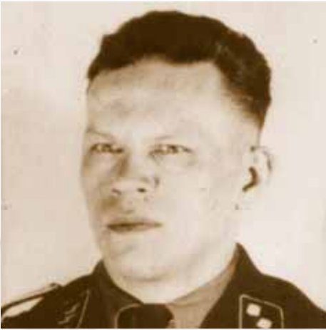
Lagerkommandant Egon Zill