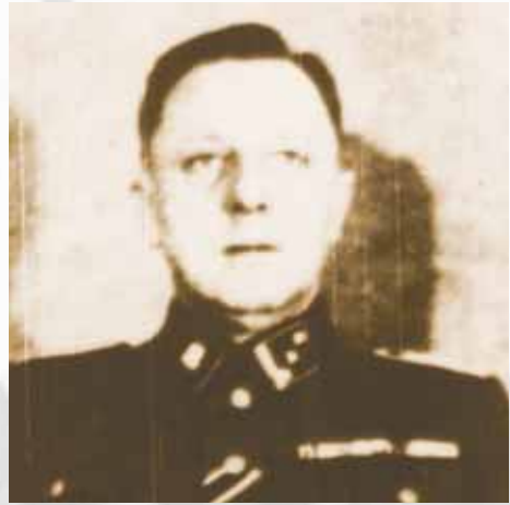
Lagerkommandant Paul Sporrenberg

de. Eine weitere „Aufwertung“ in dem KZ-System erfuhr das Lager am 7. Februar 1942 durch die Zuordnung zum Wirtschafts- und Verwaltungshauptamt der SS (WVHA). Dies fiel noch in die Zuständigkeit Zills, der im April 1942 als stellvertretender Kommandant zum KZ Natzweiler im Elsass versetzt wurde. Als dritter Kommandant des Lagers Hinzert folgte ihm Paul Sporrenberg. Formal behielt das SS-Sonderlager/KZ Hinzert seine Eigenständigkeit, bis es am 21. November 1944 dem Konzentrationslager Buchenwald zugeordnet wurde.