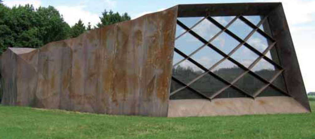
Außenansicht des Dokumentations- und Begegnungshauses

In der Mitte des Ausstellungsraumes steht ein Projektionswürfel für Informationen grundlegender Art, die mittels eines Beamers von der Decke auf den Würfel übertragen werden. Hier sind Informationsfilme zum Lager zu sehen, aber auch elektronische Karten zur Stellung des SS-Sonderlagers im nationalsozialistischen KZ-System abrufbar. Außerdem kann man sich anhand historischer Fotos einen Eindruck vom Barackenlager der Häftlinge machen. Der Blick der Besucher/innen beim Betreten des Ausstellungsraumes wird dann auf das große Fenster fallen, das